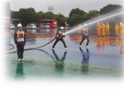
(株) タツノ横浜工場 自衛消防隊