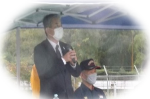
大井川栄区自衛消防連絡協議会会長 【激励】