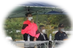
角田栄火災予防協会会長 【激励】