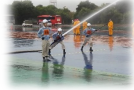
芝浦メカトロニクス(株) 横浜事業所自衛消防隊