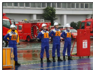
【屋内消火栓操法Ⅱの部 ：男性または男女混成】 住友電気工業（株） 横浜製作所自衛消防隊

栄火災予防協会会長、栄区自衛消防連絡協議会会長より激励をいただき、「屋内消火栓操法の部」の操法が開始されました。