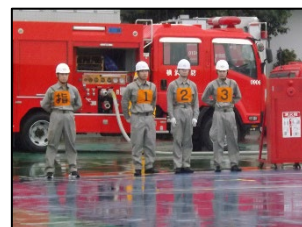
【屋内消火栓操法Ⅱの部 ：男性または男女混成】 栄区役所自衛消防隊（男性）