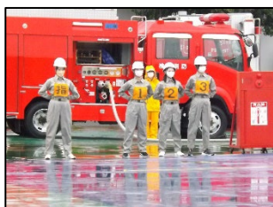
【屋内消火栓操法Ⅰの部：女性】 栄区役所自衛消防隊（女性）