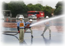
(株) ニコン横浜製作所 自衛消防隊